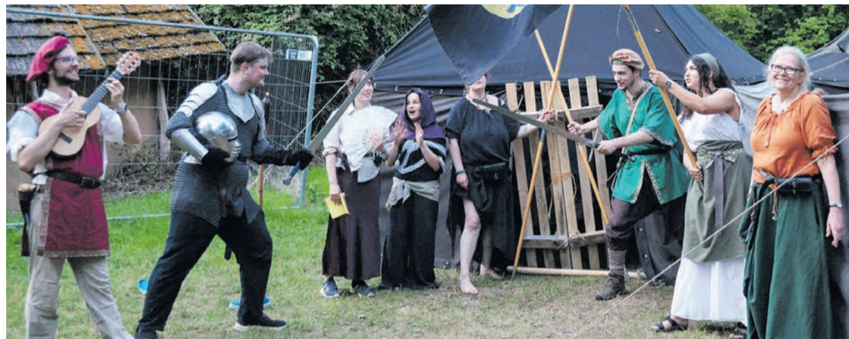
Helfer und Unterstützer der Ritterallye vor der Burg am Grünen See.

Nach Mittelaltermarkt und der Ritterallye kommt das Turmfest