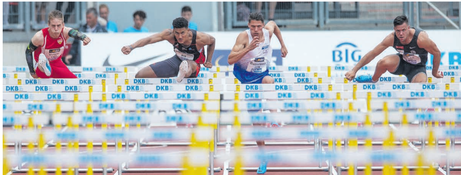
110-Meter-Hürdenlauf ist eine der Mehrkampfdisziplinen bei den Männern.