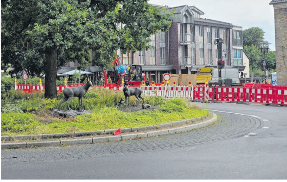
Die Bodenwellen im Kreisverkehr werden immer ausgeprägter.