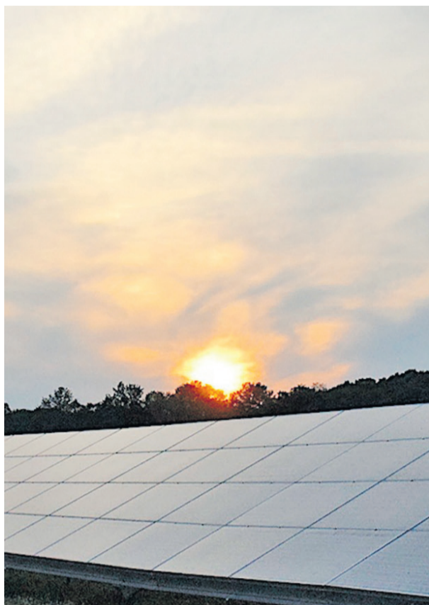
Solkraft: Eine Investition in die Zukunft.

Vorgesehen ist eine Teilnahme an der nächsten EEG-Ausschreibung, um einen Teil der Erlöse über eine gesetzliche Mindestvergütung abzusichern. Der Batteriespeicher erlaubt eine zeitversetzte Vermarktung des Stroms zu po-