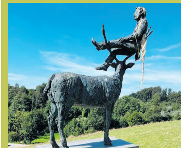
Der „Mann auf dem Hirschgeweih“.

Hinweise nimmt die Polizei Ratingen, Telefon 02102 9981-6210, jederzeit entgegen.