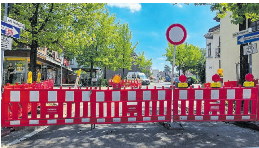
Noch ist kein Durchkommen

nen und Anwohner des Wohnquartiers am Kohlendey / Am Heck / Am Heyntges in Lintorf haben inzwischen seit Monaten vor Augen, dass die Erneuerung von Kanälen mit anschließender Straßenerneuerung eine langwierige Ausdauerdisziplin ist. Davon betroffen war auch der nahegelegene Einzelhandel an der Speestraße. Dort musste im wahrsten Sinn des Wortes viel Ausdauer und geduldige Disziplin bewiesen werden, um die alltäglichen Auswirkungen der monatelangen andauernden Tiefbauarbeiten zu bewältigen. Jetzt ist es endlich soweit: Der Einmündungsbe- reich der Speestraße zum