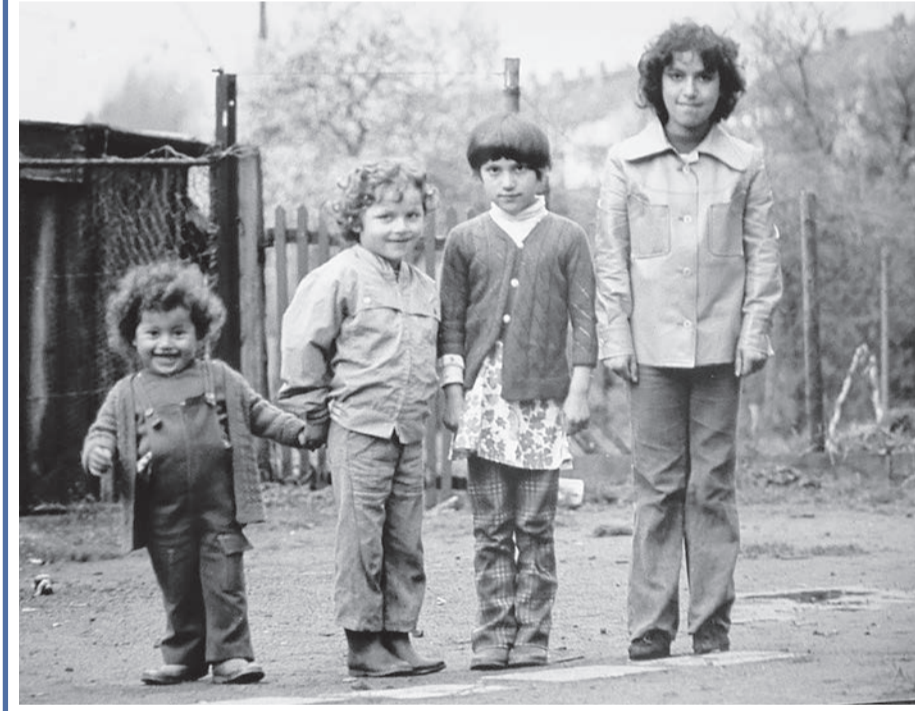
Eine eindrückliche „Spurensuche“ zeigt die Gastarbeiter und ihre Kinder im Ratingen der 1970er Jahre.

Entsprechend miserabel wurden viele von ihnen behandelt. Um auf die Zustände aufmerksam zu machen, hielt Naber, gemeinsam mit einem befreundeten Fotografen, die Menschen in ihrem Wohnumfeld bildlich fest. Die Fotodokumentation zeigte er dann öffentlich - und trat damit manch einem Vermie-